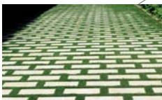
'Groene' parkeerplaatsen Betongrassdallen, type 'grasslines'