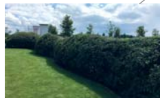
Gemengde massieven: gloeiende sneeuwijze aangeplant op heuvels