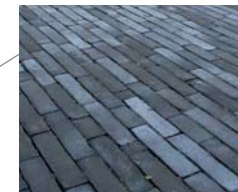
Verhardingen in kleiklinkers, met open voeg