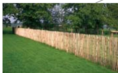
Afscheiding privé terrassen met kastanje hekwerk