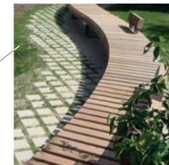
Houten zitbanken, draaiende beweging